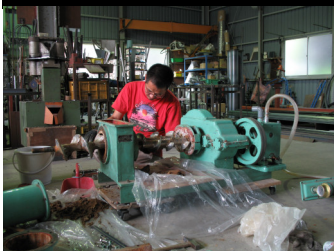
真空土練機をオーバーホール 根気と注意深さが要求される

多分、いや間違い無くこういう作品を作る陶芸家は、笠間では彼しかいない。その表情は実にユニーク。カップや鬼が酒器を手にして宴会を繰り広げている。大きいものは高さ40センチほどもある。