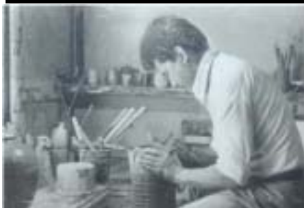
●ロクロをひく創業者・陶芸家時代

父はやきものでは苦労人だったと思います。そうした苦労を20年以上続けたのもかかわらず、窯づくりをするようになりました。益子の製陶所でガス窯を作ると、既存の石膏型を使った新しい作品作りを教えてあげるなど、自分の経験に基づいてアドバイスをしていました。すると当然効率良く作品が出来上がるので、いつしか「大築窯炉の窯を買おうと仕事が忙しくなる」という噂がたつほどになりました。